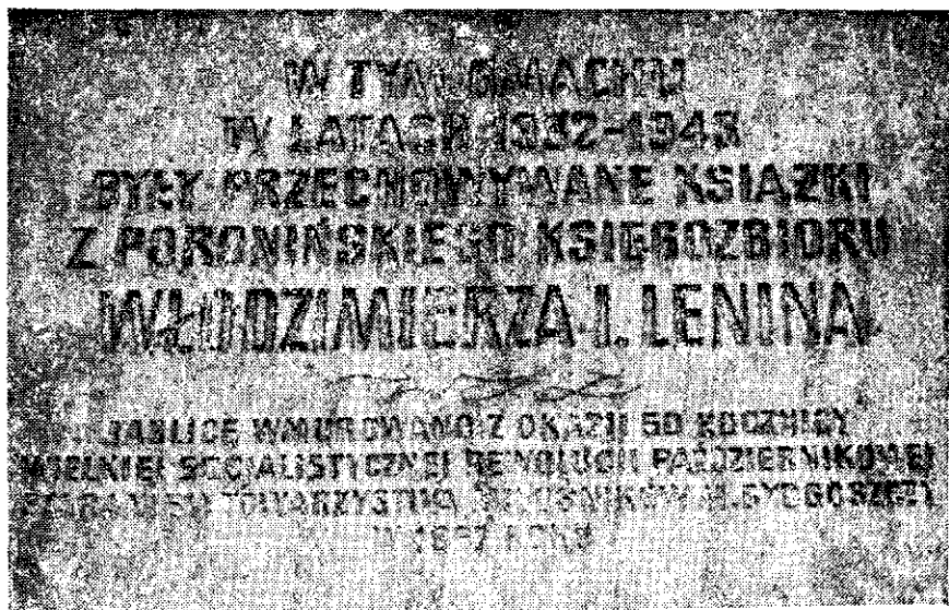
Tablica pamiątkowa na gmachu Miejskiej Biblioteki Publicznej w Bydgoszczy.